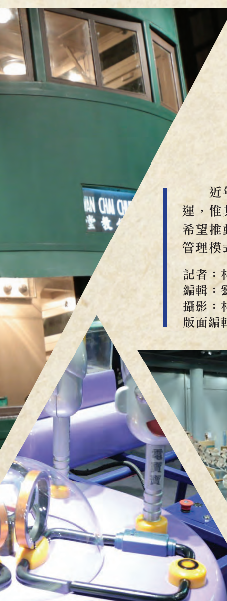
鏡子世界 World of Mirrors

記者：林藹琦 黃姿慧 梁中勝 陳偉城 呂穎嫻 編輯：劉穎芯 高樂瑤 梁穎彤 李詩慧 攝影：林藹琦 梁中勝 呂穎嫻 版面編輯：余穎恒